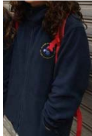
Forro polar azul marino con el escudo del Grupo bordado.