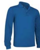
Opcional Polo color azul royal de manga larga con el escudo del Grupo bordado