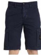
Pantalón corto o largo de pana o loneta color azul oscuro