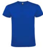
Camiseta color azul royal de manga corta con el escudo del Grupo bordado para todas las secciones