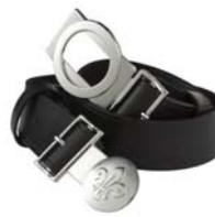
Cinturón scout para todas las secciones