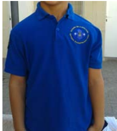
Polo color azul royal de manga corta con el escudo del Grupo bordado